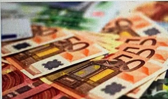
HCnieuws Financieel zwaar weer op komst in Haarlemmermeer - H...