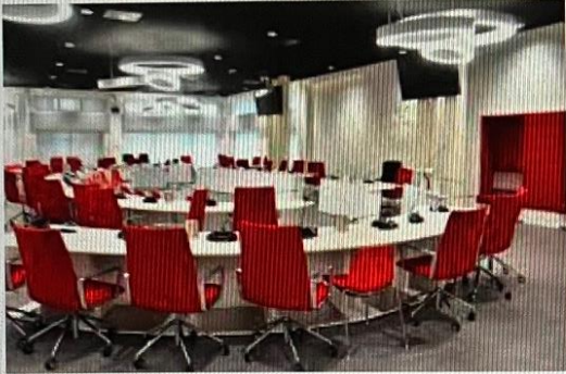
zoetermeer actief Voorjaarsdebat: zwaar weer voor gemeente - zoeterme...