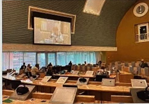
De Orkaan Voorjaarsnota Zaanstad: zwaar weer voor de geme...