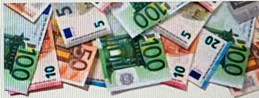
Cultuur & School Utrecht Financiële steun voor maatschappelijke instellingen ...